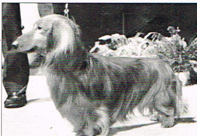
Ci-dessus: le Superchien de l'année 1989, ayant obtenu 48 pts.: Teckel à poil long Garfield de Ranguiroa Ci-contre: 2ième meilleur pl. avec 39 pts.: le Schnauzer (poivre et sel) Kojak de Ludolphi.

Le 22 février, PEDIGREE PAL a invité les éleveurs ayant remporté le plus de points avec leurs chiens, pour un grand dîner dans le bel hôtel "Château du Lac" à Genval, où la remise des prix devait avoir lieu. Tout comme il faut: l'apéritif, le dîner aux chandelles, les allocutions, la présentation