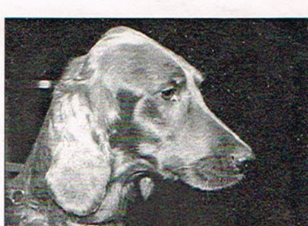
3ième meilleur pl. avec 28 pts. le setteur irlandais VICARY'S LITTLE LILLY